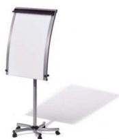
Papelógrafo, rotuladores y borrador